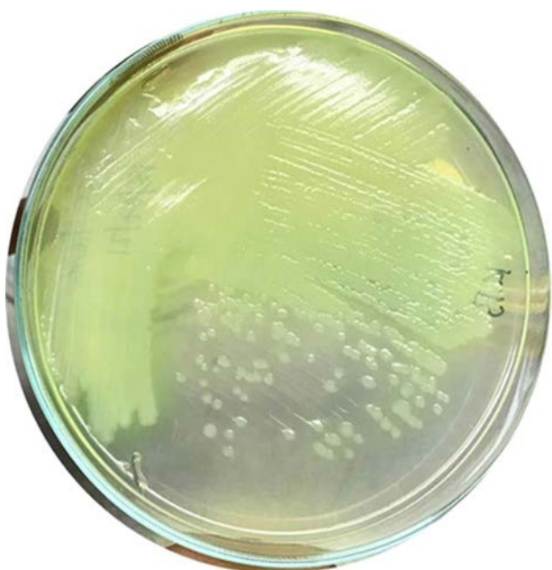
Figura 2. Crecimiento de Pseudomonas aeruginosa PSS, luego del cultivo en superficie del microorganismo, procedente de tierra de jardín estéril en medio King B. Se visualiza, además, la producción de sideróforo.

Se obtuvo, por ambos métodos de conservación, una alta recuperación de las células, al compararse con reportes previos de conservación de bacterias (6, 7). Para ambos métodos de conservación se determinaron concentraciones de células en el orden de 10^8 y 10^{10} UFC/g (o UFC/ml), a los 8 meses y de 10^6 y 10^8 UFC/g (o UFC/ml) a los 20 años, para las estrategias de conservación en tierra de jardín estéril y agua destilada estéril, respectivamente.